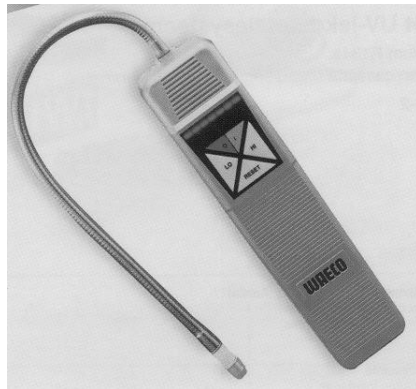
Fig. 5.1 Halogeen lekdetector

Weergave geschiedt door een pieptoon die in geval van lekkage in frequentie toeneemt. Meestal is er ook een optische controle door middel van een lichtsignaal. Fig. 5.1