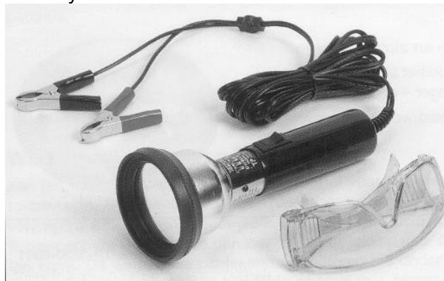
Fig. 5.2 UV-lekdetector

Door een fluoriserende-olie via de servicenippel van het lagedrukgedeelte toe te voegen kan met behulp van een UV-lamp lekkage worden opgespoord. Fig. 5.2. Langs de lekopening wordt vanuit het systeem de fluoriserende olie geperst dat oplicht met behulp van de UV-lamp. Een speciale bril maakt de lekkages duidelijk zichtbaar en beschermt de ogen tegen de UV-straling. Om lekkage te kunnen opsporen moet het systeem wel voldoende druk hebben.